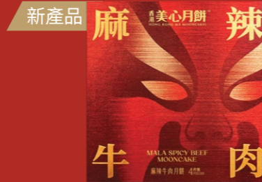
麻辣牛肉月餅 1盒4個，每個約70克