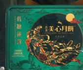
低糖蛋黃蓮蓉月餅 (新包裝)