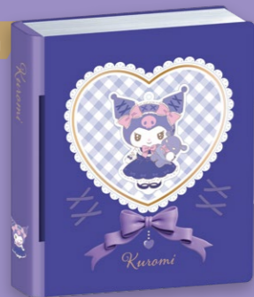
Kuromi月餅禮盒 (蛋黃白蓮蓉月餅) 1盒4個，每個約70克