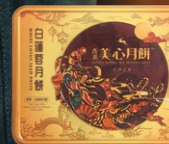
雙黃白蓮蓉月餅 (新包裝)