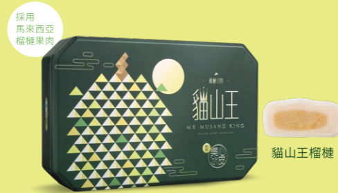
貓山王榴槤冰皮禮盒* 1盒6個，每個約60克