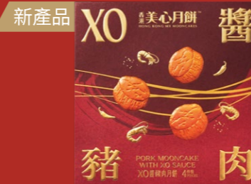
XO醬豬肉月餅 1盒4個，每個約70克