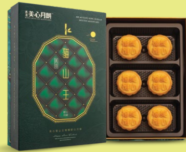
貓山王榴槤軟心月餅* 1盒6個，每個約45克